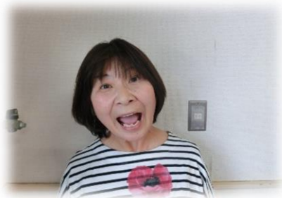
笑いましょう わっははー