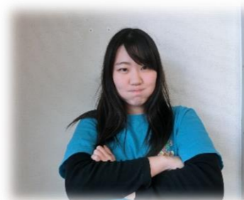
怒りましょう いしんいしんいしん