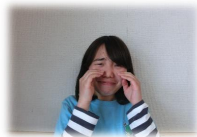
泣きましよう えんえんえん