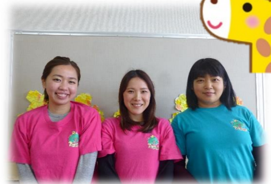
きりんぐみ しまだ つだ やました