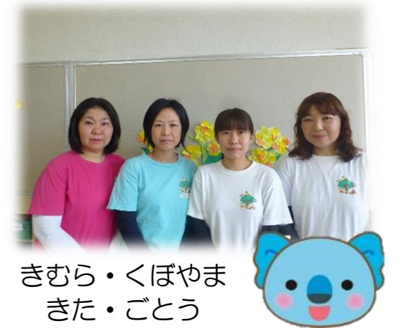
きむら・くぼやま きた・ごとう