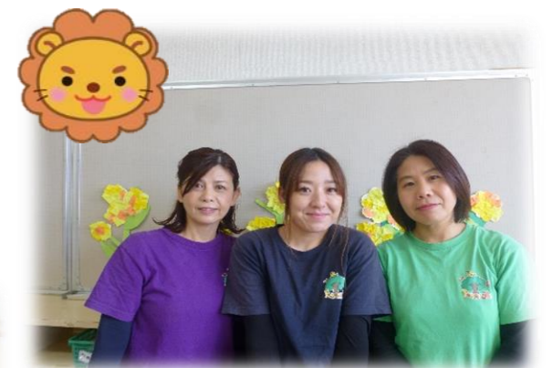
らいおんぐみ かの みやひさ ほり