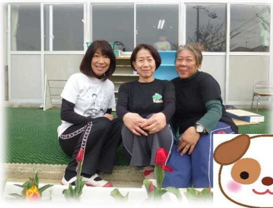
きむら のがみ ひらいで じむしょ