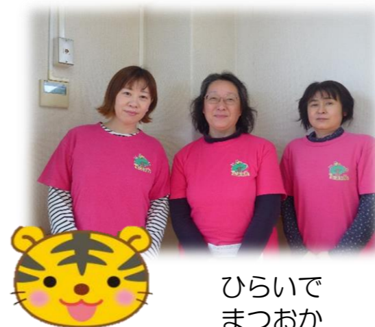
ひらいで まつおか ひがの