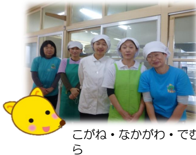
こがね・なかがわ・でむら