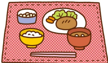
①ごはんやおかずから食事としてとる