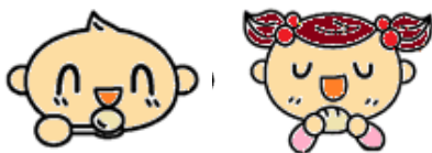
③食べ物を消化吸収するときに見える燃焼水